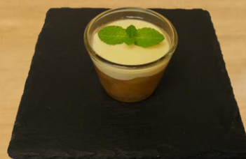
Zitronen Joghurt Creme